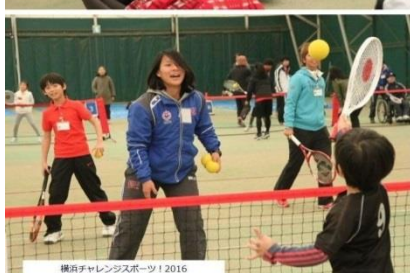
横浜チャレンジャーズスポーツ 2016