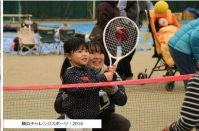
横浜チャレンジャーズスポーツ 2016