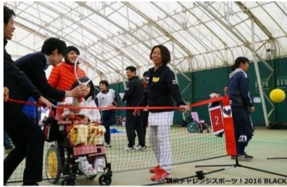
横浜チャレンジャーズスポーツ 2016 BLACKSOX