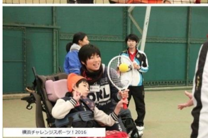
横浜チャレンジャーズスポーツ 2016