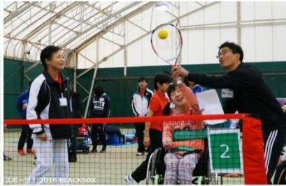
スポーツ 2016 BLACKSOX