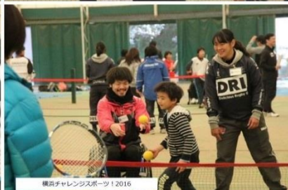
横浜チャレンジャーズスポーツ 2016