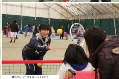
横浜チャレンジャーズスポーツ 2016