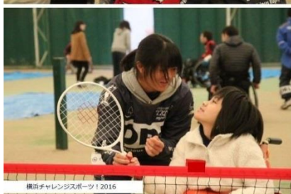
横浜チャレンジャーズスポーツ 2016