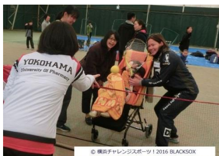
障がい児と テニス部・女子ラグビー選手

障がい児 26 名 ⇔ 横浜薬科大学テニス部 12 名 サポーター-Kids 11 名 YOKOHAMA TKM 数名 テニス初めて健常児 14 名 ⇔ 横濱義塾 10 名 YOKOHAMA TKM 数名 過不足を BLACKSOX スタッフで埋める。他、スタッフはサポートのサポートにつく。