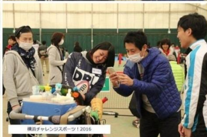
横浜チャレンジャーズスポーツ 2016