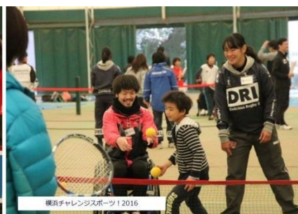
障がい児とサポーター-Kids と車椅子ラグビー選手