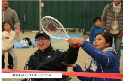
横浜チャレンジャーズスポーツ 2016