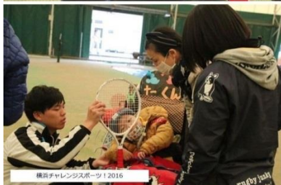
横浜チャレンジャーズスポーツ 2016