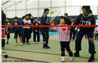
スポーツ 2016 BLACKSOX