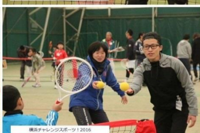
横浜チャレンジャーズスポーツ 2016