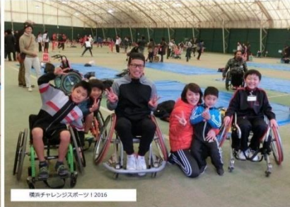
横浜チャレンジャーズスポーツ 2016