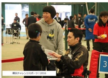
パラリンピック銅メダリスト 山口選手と障がい児