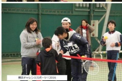
横浜チャレンジャーズスポーツ 2016