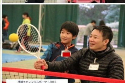
横浜チャレンジャーズスポーツ 2016