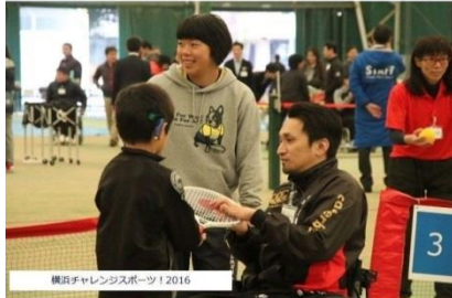
横浜チャレンジャーズスポーツ 2016