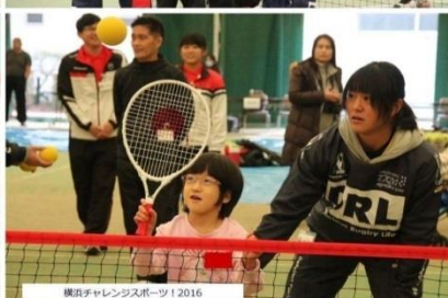
横浜チャレンジャーズスポーツ 2016