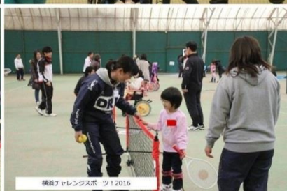
横浜チャレンジャーズスポーツ 2016